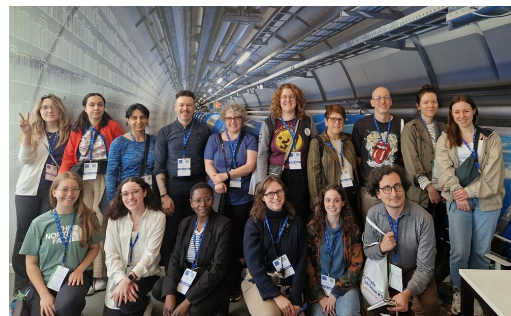
Le groupe lors de la visite du CERN à Genève.